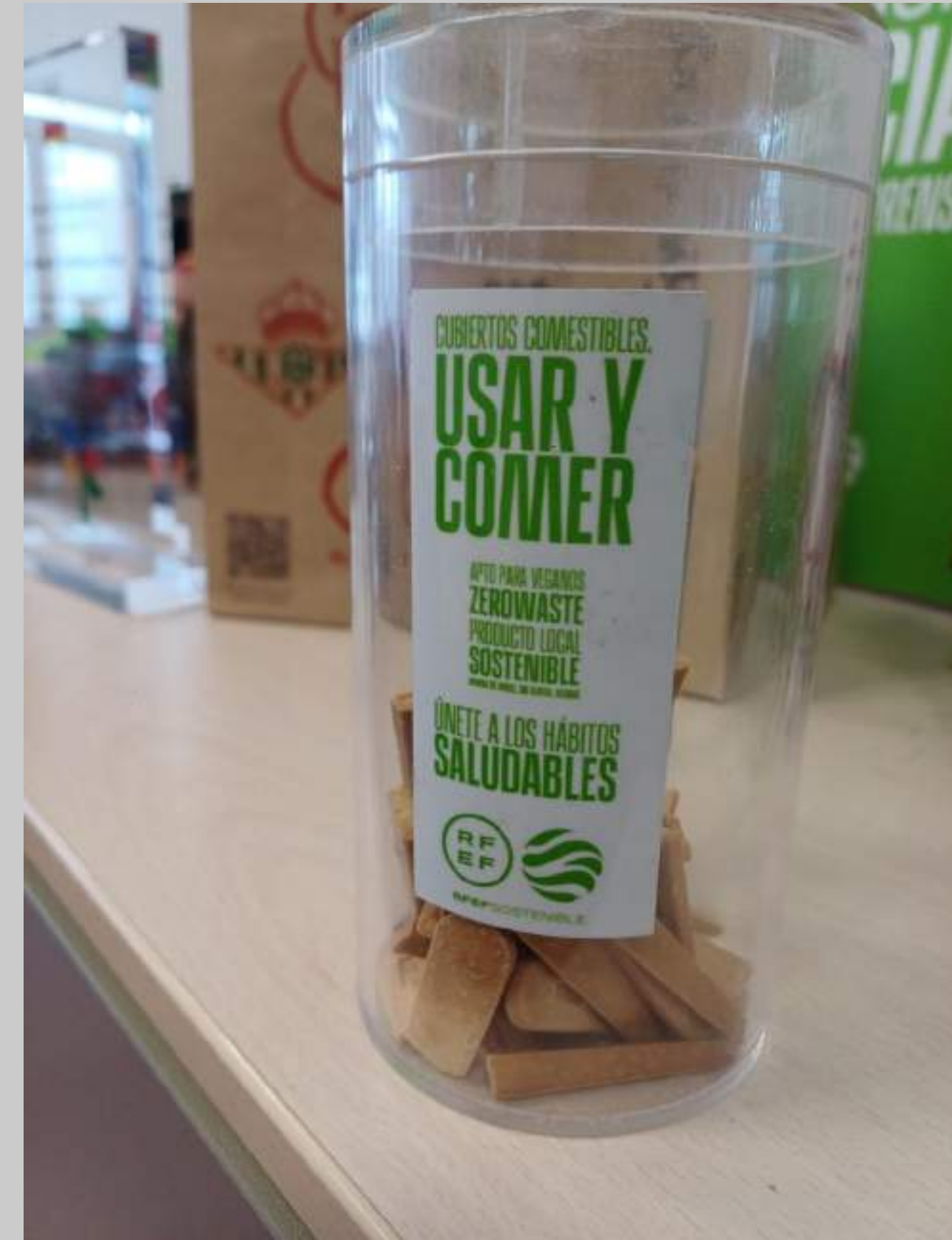
Eliminación de plásticos en restauración y cambio por botellas de cristal