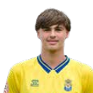
Diego García Defensa